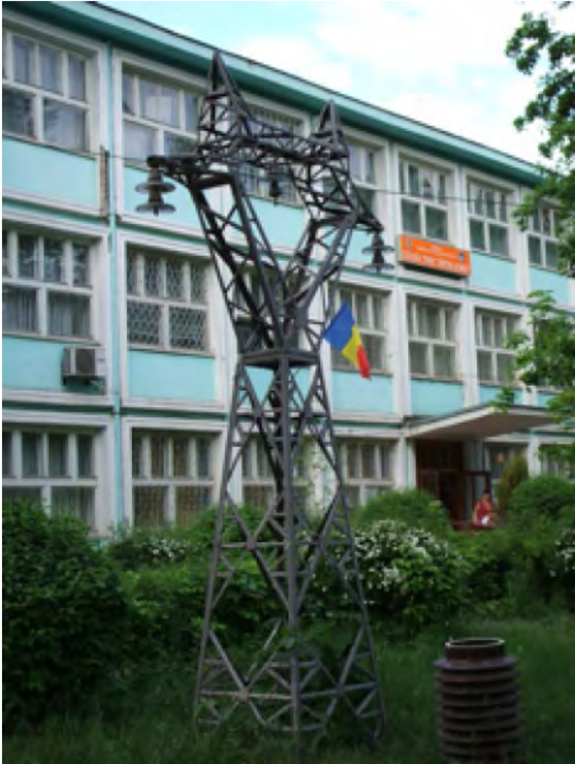
Colegiul Tehnic Dimitrie Leonida

Bugetul local va contribui cu suma de 31.806 lei la derularea proiectului european " Pasi in educatia tuturor ", implementat de catre Colegiul Tehnic Dimitrie Leonida din Iasi . Proiectul isi propune prevenirea si corectarea parasirii timpurii a scolii in randul a 390 de prescolari , elevi cu risc de abandon scolar, prin derularea de programe integrate de sprijin pentru acestia. Grupul tinta va fi format din persoane care au domiciliul intr-o zona defavorizata din judetele Galati, Braila, Hunedoara