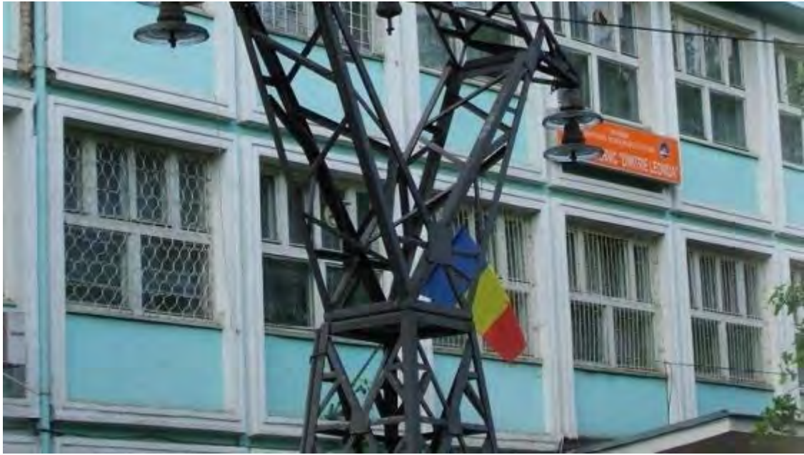
Colegiul Tehnic Dimitrie Leonida