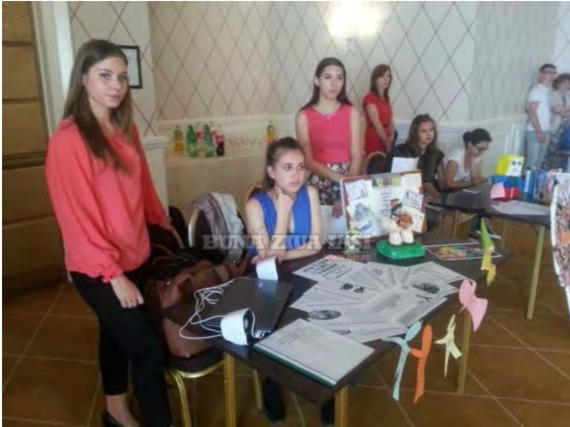
Colegiul Dimitrie Leonida Iasi 1